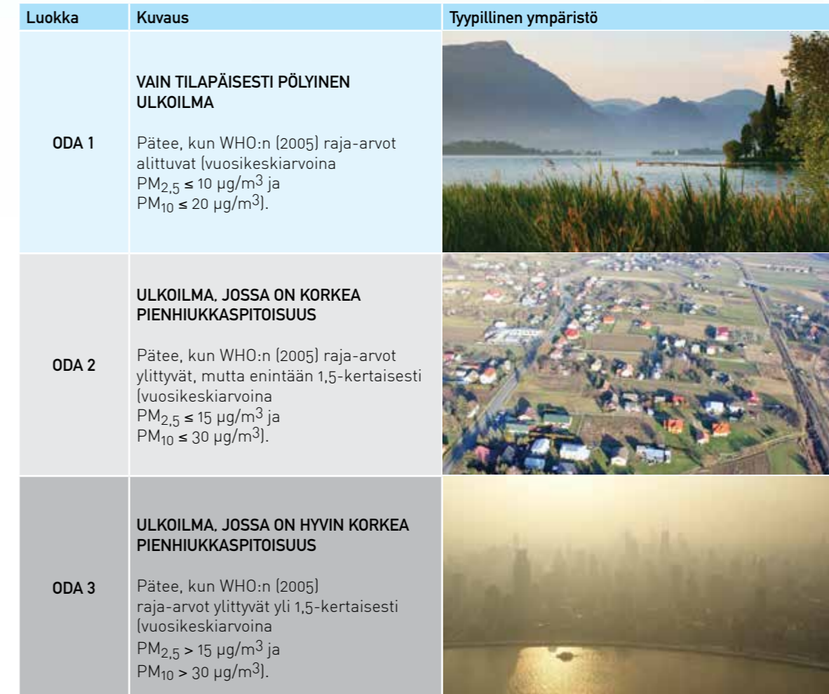
Taulukko 1: Ulkoilmaluokat