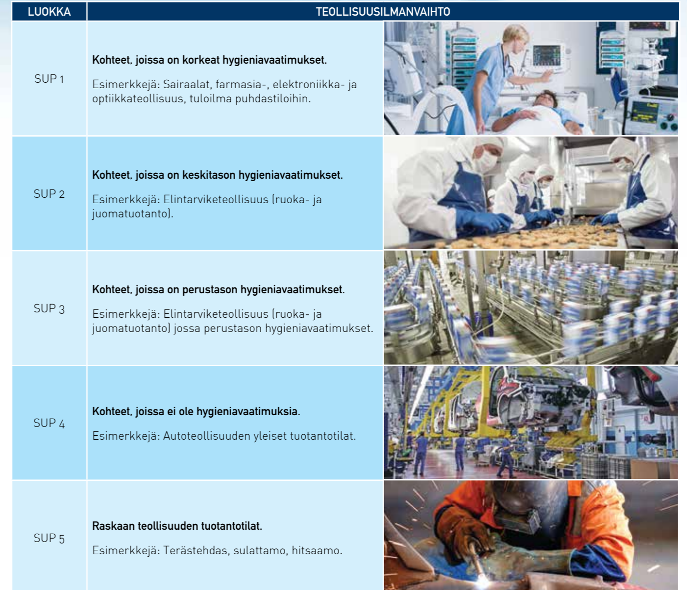
Taulukko 4: Teollisuusilmanvaihto - suuntaa-antavia esimerkkejä SUP-luokkien käyttökohteista