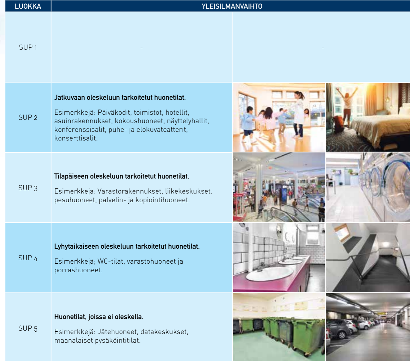
Taulukko 4: Yleisilmanvaihto - suuntaa-antavia esimerkkejä SUP-luokkien käyttökohteista

Taulukossa 4 on esitetty tyypillisiä eri tuloilmaluokkien (SUP) käyttökohteita: